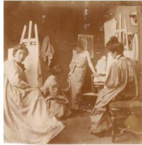
Un atelier de femmes peintres vers 1890, photographie d'époque