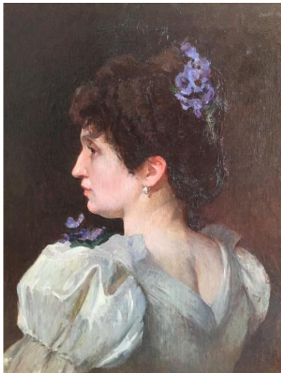
Jules ADLER, portrait d'une jeune femme de profil