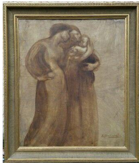
Eugène CARRIERE, Les Jeunes mères